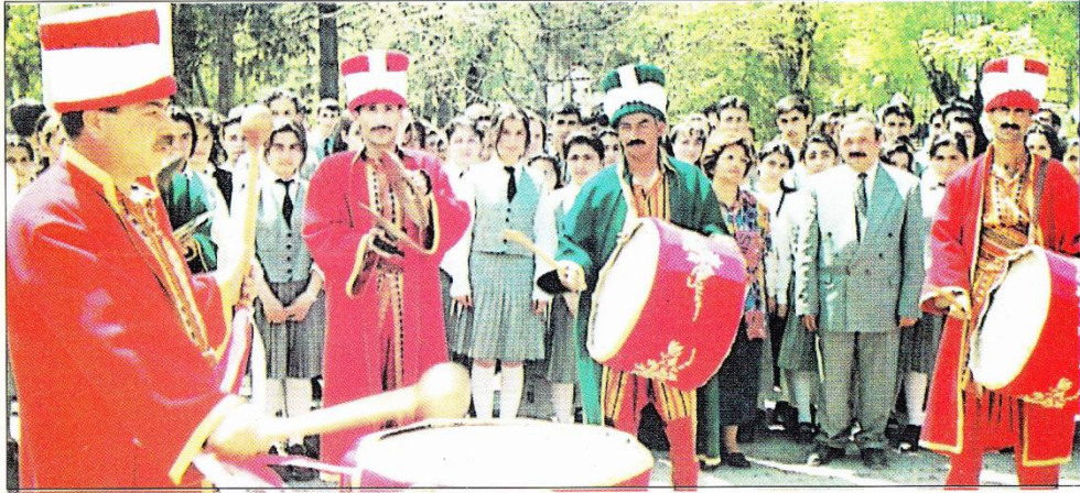
Kayseri lisesi'nin 100. Yıl törenlerinden bir enstantane

Yayanlanan eserin nasıl dar şartlar içerisinde hazırlandığı gözönüne alındığında, elde edilen başarının önemi daha da günyüzüne çıkıyor. Buradan, ŞEREF BELGESELİ'ne katkıda bulunan herkesi biz de kutluyor, Kayseri'mize layık bir külliye oluşturulmasına yardımcı oldukları için teşekkür ediyoruz.